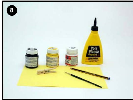
Ahora haremos una abeja