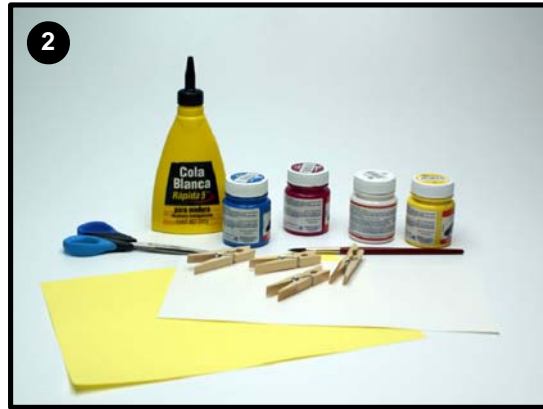
Material que necesitaremos