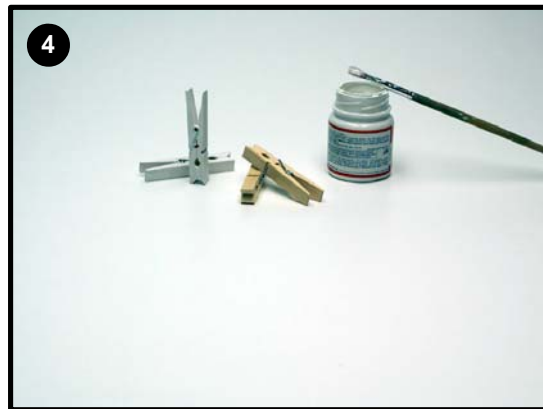
Pinta las pinzas