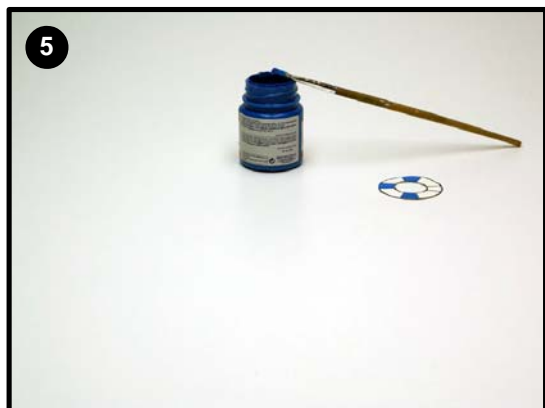
Pinta los dibujos