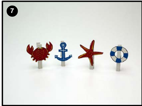
Cada pinza con su nombre