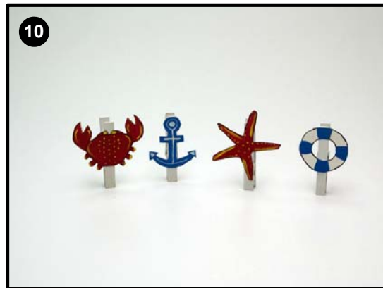
Ya puedes usar tus pinzas