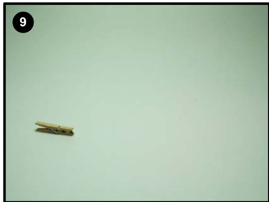
También podemos usar otras manualidades